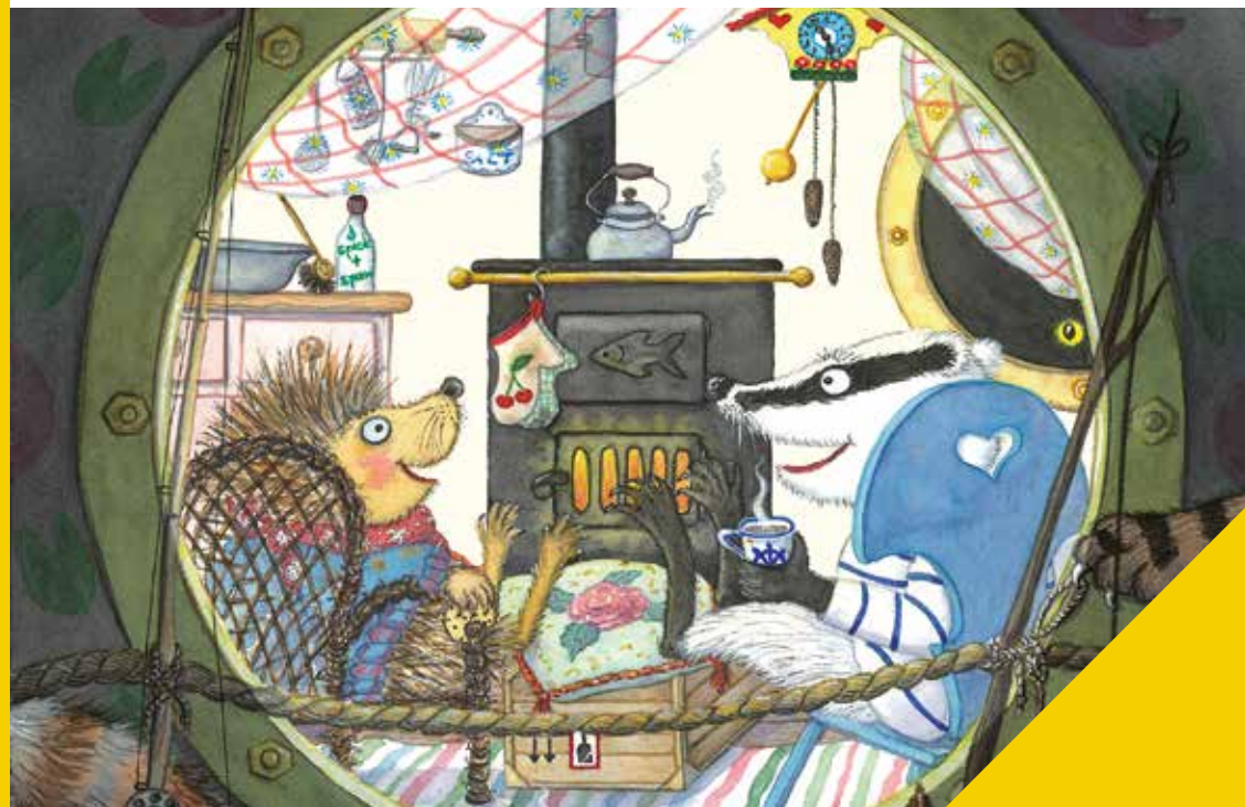
Illustration aus: Doris Lecher «Domestik. Dachs und die Katzenpiraten» nach Denis Watkins-Pichford ©2018 Baschlin, Gianus. 05.18/1600_0233_wik_Ly Papier: 100% Altpapier, CO2-neutral